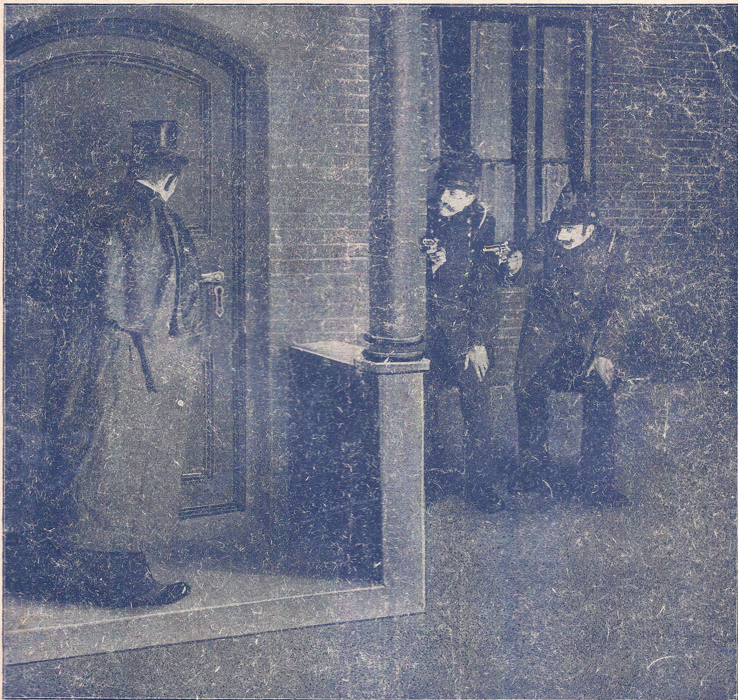
Pag. 14. Niet zonder moeite scheen hij het slot te vinden.